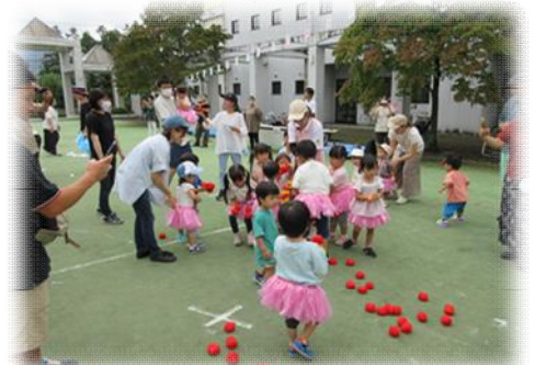
赤組・白組に分かれての玉入れ