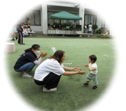
おかあさんのところまで よーいドン!